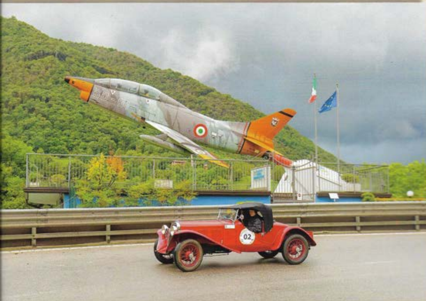
Gianpaolo Cavagna - Aldo Olli