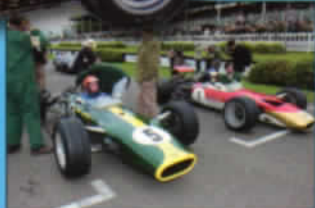
GOODWOOD REVIVAL MEETING