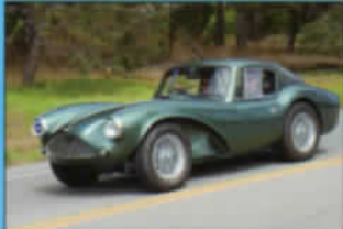
CONCOURS ELEGANCE PEBBLE BEACH