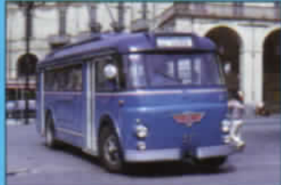
GLI AUTOBUS DI TORINO